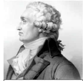
Marie Jean Antoine Condorcet

Görkəmli riyaziyyatçı və filosof Marie Jean Antoine Condorcet (1743-1794) ümid edirdi ki, elmin tərəqqisi sənayenin inkişafına və insan ömrünün uzanmasına gətirdiyi kimi idrak insanları ideala gətirəcək. Millətlər və siniflər arasında bərabərsizlik, insanlar arasında sosial bərabərsizlik aradan qalxacaq və insan kamil olacaq. Bunun üçün hamıya eyni imkan yaranan ümumtəhsil sistemi yaradılacaq. Dini və mədəni səviyyə yüksələcək, irqçilik aradan çıxacaq, xəstəliyə və qocalığa görə təqaüdlər veriləcək, yoxsulluq və dəbdəbə aradan götürüləcək, qadınlar və kişilər arasında bərabərlik əldə ediləcək, müharibələr qadağan olunacaq, ticarət azad olacaq. Qeyd edək ki, bu düşüncələri o, Konvent tərəfindən haqqında həbs qərarı çıxdıqdan sonra, qaçıb gizləndiyi və ömrünün ölüm təhlükəsi ilə üz-üzə dayanan son ilində qələmə almışdır (və sonra, həbsdə intihar etmişdir). Onun gələcəyə nikbin və parlaq baxışı vardı: “Günəş öz ağılından başqa heç bir ağanı tanımayan azad insanların məskən saldığı Yer üzünü işıqlandıracaq”. 5