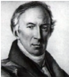
Nikolay Mixaylovich Karamzin

Nikolay Mixaylovich Karamzin (1766-1826) bədii əsərlərini (şeir və nəsr) əski slavyan söz, ibarə və üslubunda deyil, canlı danışıq dilində yazmaqla rus ədəbi dilinin inkişafında fəvqəladə rol oynadı. Azərbaycanda həmin rolunu bir qədər sonra M.F. Axundov oynadı. Karamzin "Rusiya dövlət tarixi" ("История государства