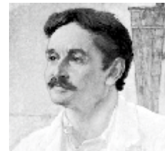
Sir Arthur Evans