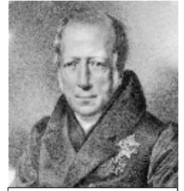
Vilhelm von Humboldt

açıq sübutu kimi qəbul edirlər. Vilhelm von Humboldt 'a (1767-1835) görə tarixi təsvir bədii təsvirə bənzər şəkildə təbiəti təqlid etməkdir (yamsılamaqdır). Tarixçi də rəssam kimi yalnız təhrif olunmuş şəkildə yaradır. 5